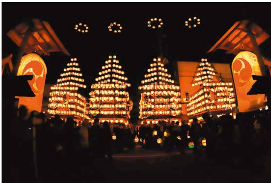
二本松の提灯祭り

真夏の日差しが照りつけ、向日葵が空に向かって元気よく咲く季節となりました。今年の安達地方ではあちこちで夏祭りの便りも聞こえてきており、当たり前だったかつての日常を取り戻しつつあることを実感しております。